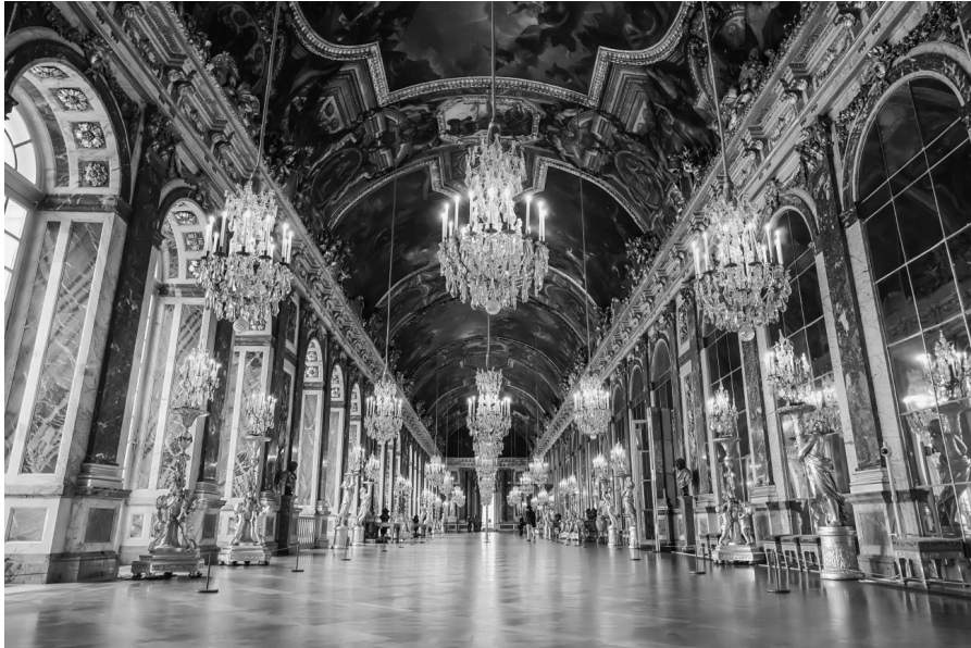
La Galerie des Glaces

En 1661, Louis XIV a décidé de construire un immense palais pour y vivre, à environ 30 kilomètres de Paris. Mais ce n'était pas seulement la résidence des rois et reines de France. Versailles accueillait aussi toute la cour royale, c'est-à-dire toutes les personnes qui vivaient dans l'entourage du Roi, comme les conseillers et les ministres.