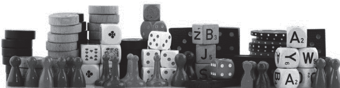
mede mogelijk gemaakt door Toys & Me, NVB, Spel4You, Magic Bag