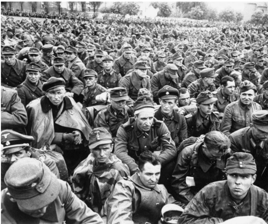
Foto van Duitse krijgsgevangenen van de westerse geallieerden. Deze gevangenen zijn opgesloten in Rheinwiesenberg , waar tussen april en oktober 1945 meer dan een miljoen gevangenen verblijven: