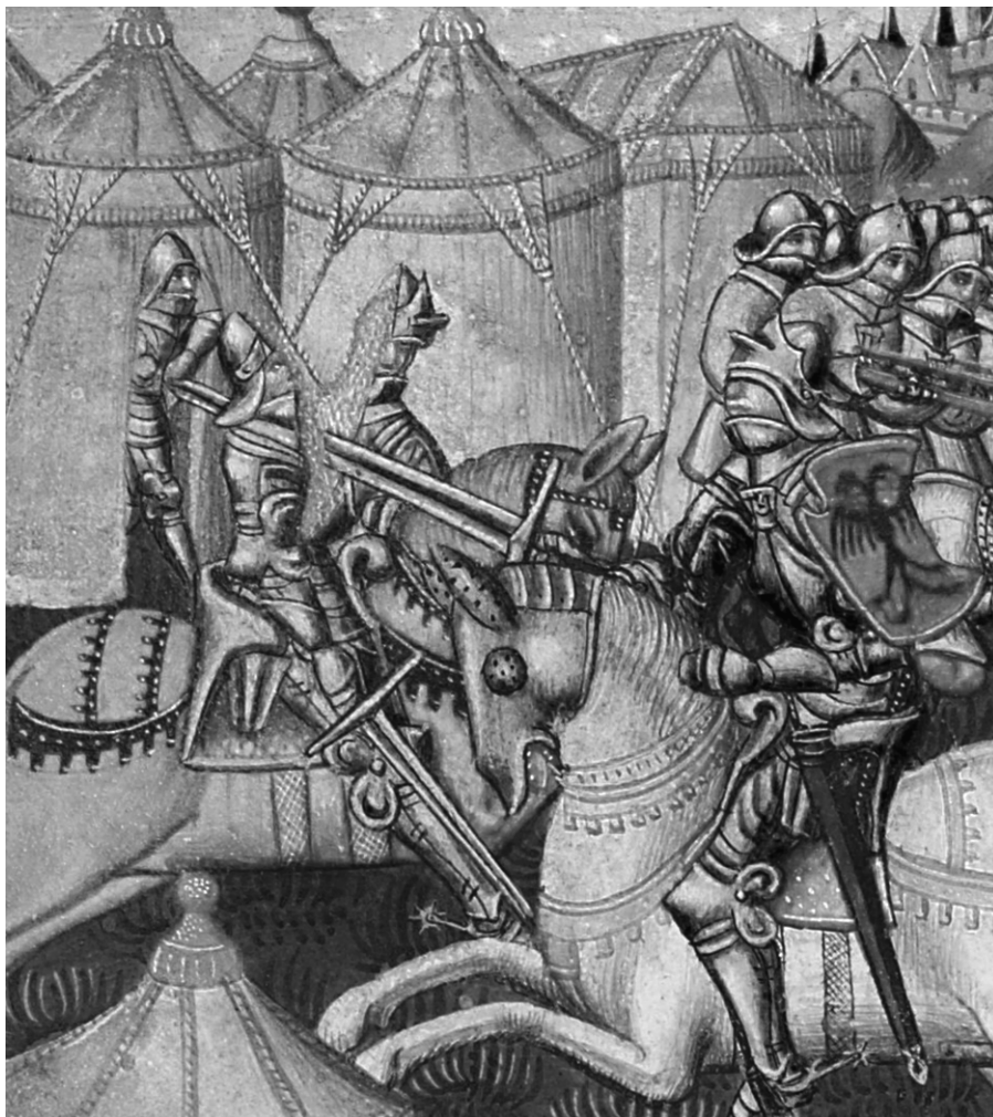
Hector valt Patroclus aan, illustratie in een vijftiende-eeuws handschrift.