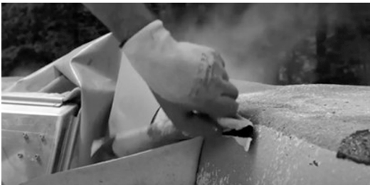
2c alle verflagen verwijderen