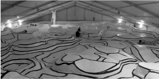
2a de lijnen schilderen

figuren 2a t/m 2d geven informatie over de restauratie.