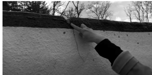
2d de conditie registreren