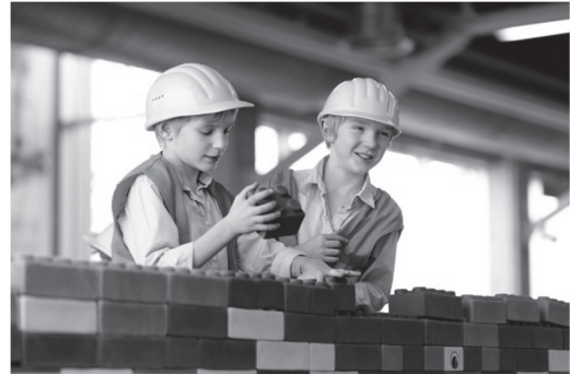
kist met grote legoblokken € 37,50