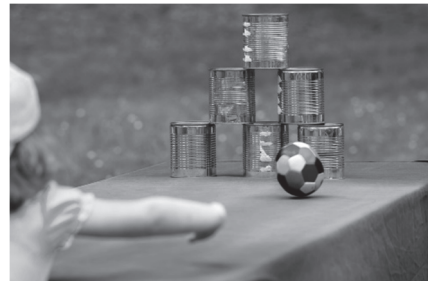
blikgooien (tafel, blikken en bal) € 5,00