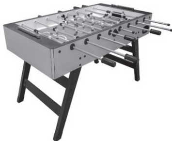
tafelvoetbalspel € 20,00 nu 2 voor € 35,00