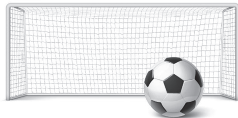
voetbalgoal € 9,00