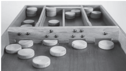
sjoelbak € 7,80