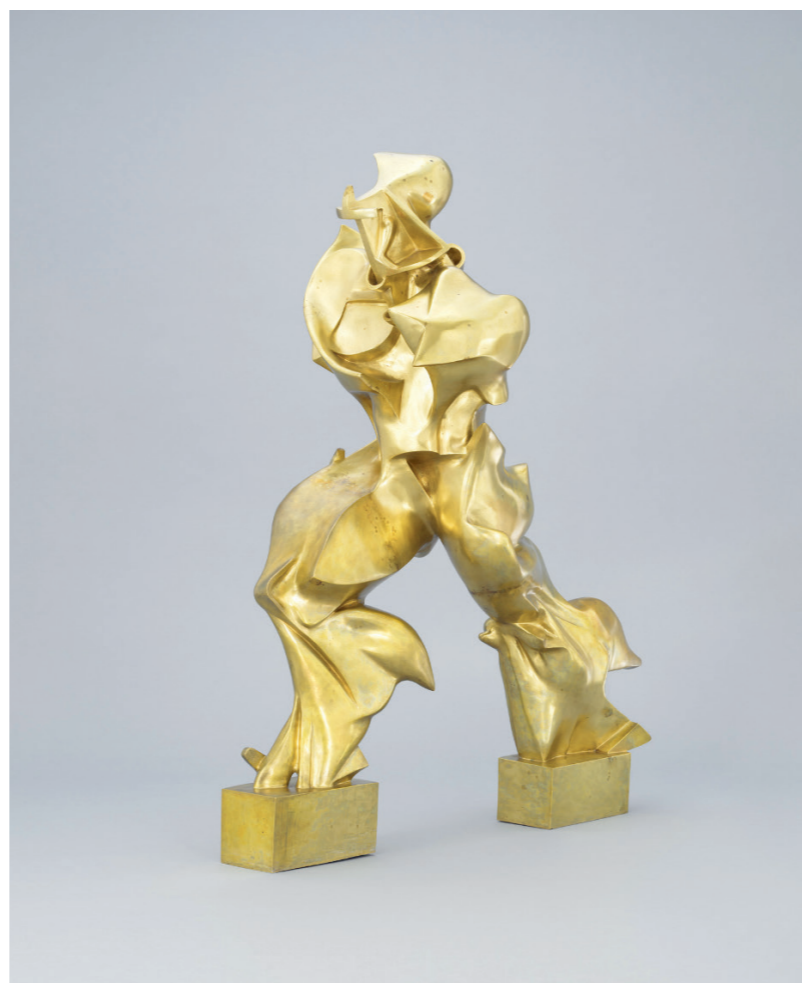
afbeelding 10, 111 x 88 x 40 cm