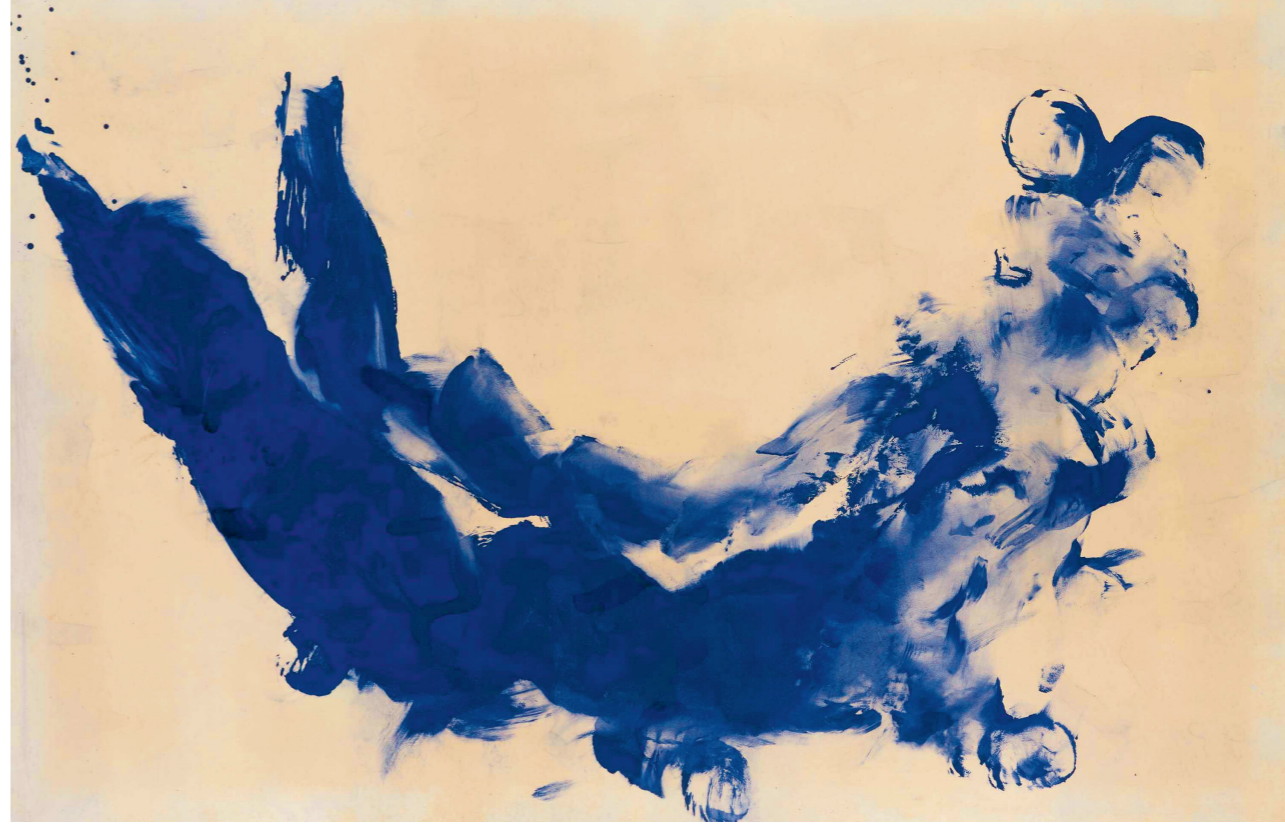
afbeelding 6, 194 x 127 cm