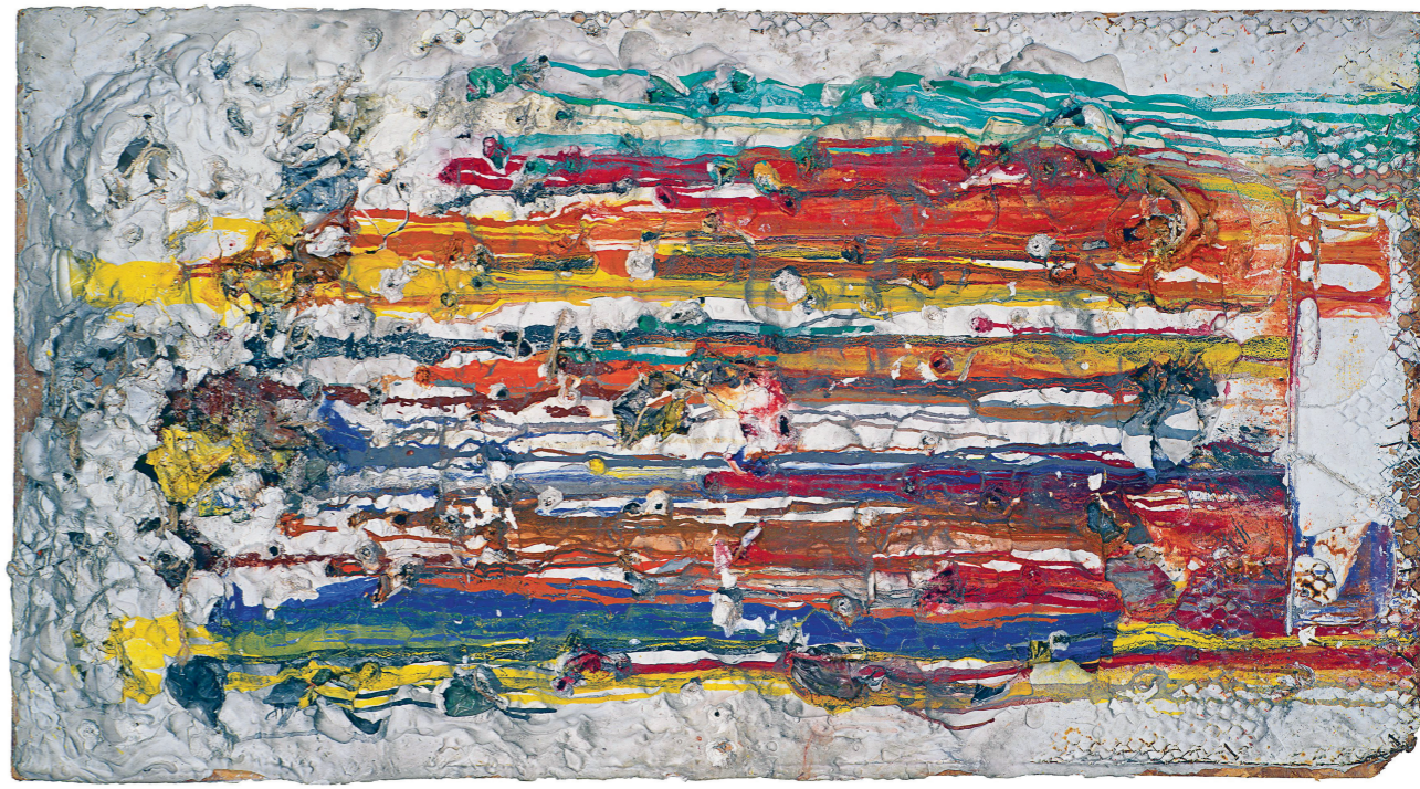
afbeelding 7, 143 x 77 x 7 cm