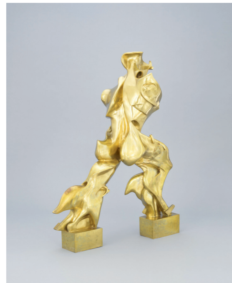
afbeelding 11, 111 x 88 x 40 cm