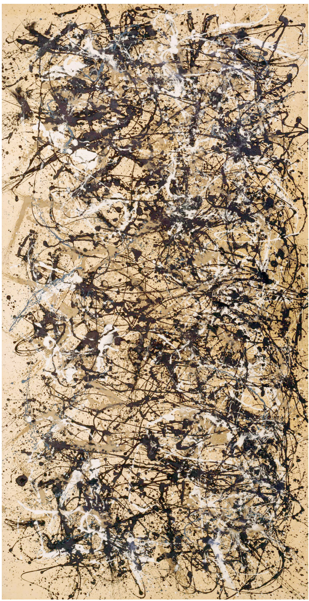
afbeelding 5, 266 x 525 cm