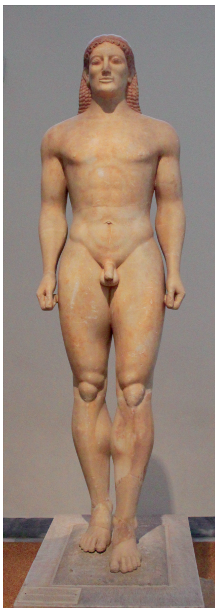
afbeelding 8, hoogte 195 cm