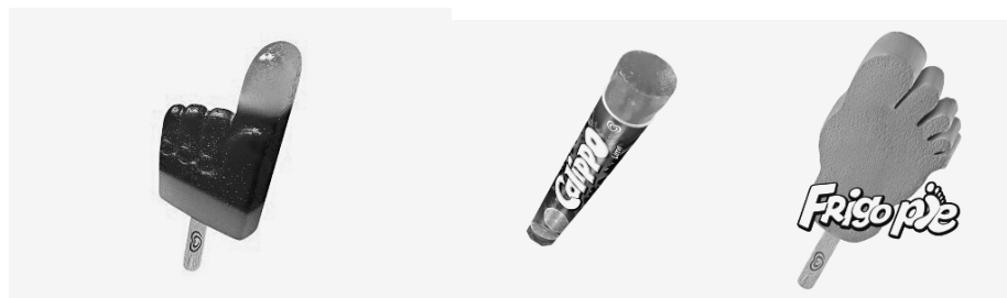
el Frigo dedo

(7) Mi historia en el mundo de los helados es la historia de una persona apasionada por el conocimiento. Es algo que heredé de mis primeros jefes y que ahora, como veterano, intento transmitir a los más jóvenes. Porque un conocimiento amplio, en cualquier momento de la vida, te 50 puede venir como anillo al (Frigo) dedo.