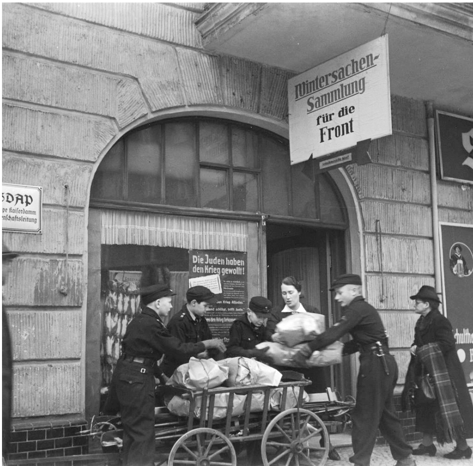
Foto van een kantoor van de vrouwenafdeling van de NSDAP in Berlijn in 1942: