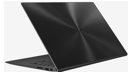
Bacer Laptop 32 GB HDD € 283 inclusief btw

Amal heeft € 239,92 van de € 500 uitgegeven. Van het geld dat ze over heeft, wil ze een nieuwe laptop kopen. IKVA.nl biedt de mogelijkheid om een refurbished Bacer-laptop te kopen voor een lage prijs. Het tekort willen haar ouders haar renteloos lenen. Amal betaalt de lening in twee maanden terug.