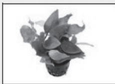
Anubias Nana Paxing

De volgende planten staan in de voorzone: