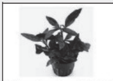
Alternanthera Rosaefolia Mini