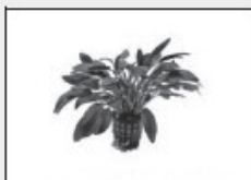
Cryptocoryne Wendtii Bruhn