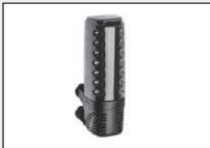
VISSIE BINNENFILTER aqua 700

Om het water in dit aquarium schoon te houden, is dit het meest geschikte filter: