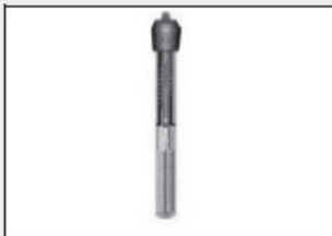
VISSIE WARMER COMFI

Met dit verwarmingselement kan het water in dit aquarium op de juiste temperatuur blijven: