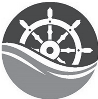
Vakantieschip de Pelikaan

Je loopt stage op vakantieschip de Pelikaan.