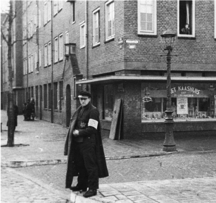
Foto van een Joodse man die ingezet werd tijdens een razzia in Amsterdam (1943):