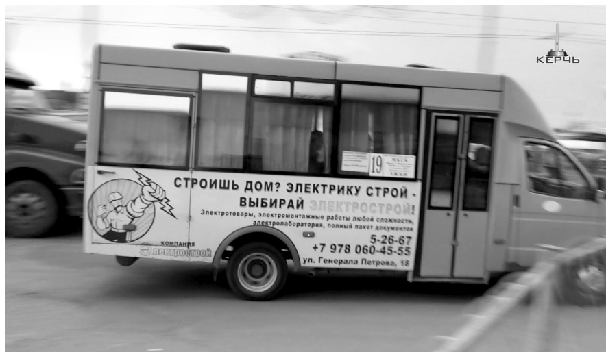
Маршрутка №19 в городе Керчь