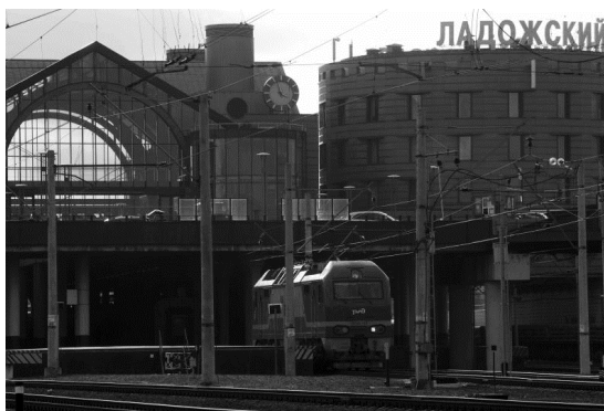
Ладожский вокзал, 2015