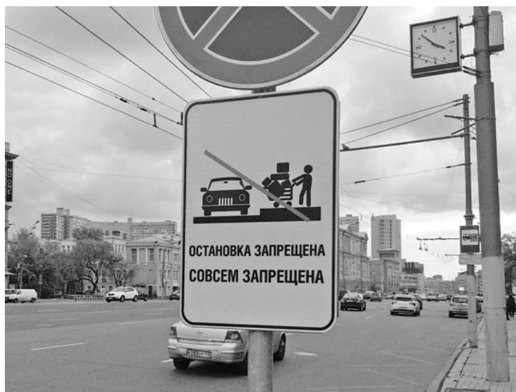
Московский комсомолец, 2014

В правительстве Москвы надеются, что такие таблички заставят водителей ответственнее подходить к парковке своих транспортных средств, а также повысят их культуру вождения в целом.