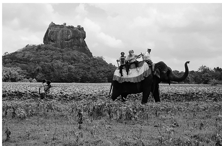
Слоны, катающие людей на спинах, очень страдают

Однако, к сожалению, в ряде регионов животные продолжают терпеть неудобства из-за содержания в неволе: недавно о судьбе 29-летнего белого медведя Артуро, живущего в вольере безо льда, узнал весь мир. 35